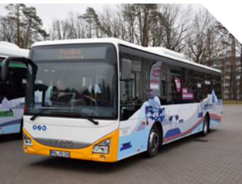
PlusBus nach Bad Freienwalde

Der PlusBus 889, der erste im Landkreis Märkisch-Oderland, verbindet stündlich den S-Bahnhof Strausberg Nord mit Bad Freienwalde über Wriezen. An den Wochenenden fährt er alle zwei Stunden. Es bestehen zeitnahe Anschlüsse zur S5 in Strausberg Nord und zur RB60 in Bad Freienwalde. Der Fahrplan der S5 bleibt nach dem 13.12.2020 unverändert, bietet jedoch zusätzliche Fahrten am frühen Morgen.