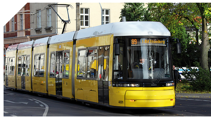
Die Tramlinie 89 Richtung S-Bahnhof Strausberg

Die Tramlinie 89 verkehrt ab Strausberg Bahnhof im Anschluss von und zur S5 in Richtung Strausberger Innenstadt zur dortigen Endhaltestelle Lustgarten. Ganz in der Nähe befindet sich der Übergang zur Straussee-Fähre, mit der man in sieben Minuten auf die gegenüberliegende Seeseite übersetzen kann. Sie ist der Ausgangspunkt für Wanderungen zum Bötzeesee, nach Spitzmühle, zum Fängersee sowie rund um den Straussee auf der Strausseepromenade. Fahrweise gibt es auch bargeldlos auf der Fähre. Mehr unter strausbergreisenbahn.de/faehre .