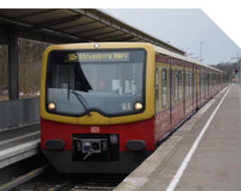
Die S5 Richtung Strausberg Nord

Der PlusBus 889, der erste im Landkreis Märkisch-Oderland, verbindet stündlich den S-Bahnhof Strausberg Nord mit Bad Freienwalde über Wriezen. An den Wochenenden fährt er alle zwei Stunden. Es bestehen zeitnahe Anschlüsse zur S5 in Strausberg Nord und zur RB60 in Bad Freienwalde. Der Fahrplan der S5 bleibt nach dem 13.12.2020 unverändert, bietet jedoch zusätzliche Fahrten am frühen Morgen.